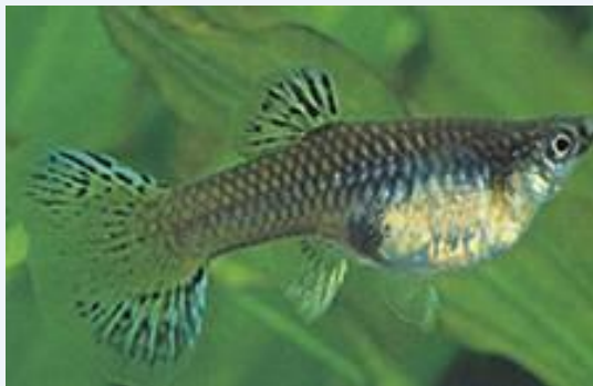
Triangel Moskou-gup (vrouw) van een gele filigreinstam.