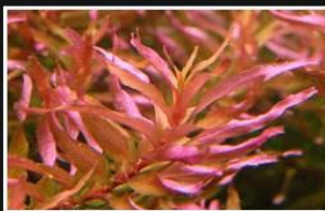
Rotala Macandra sp. Mini