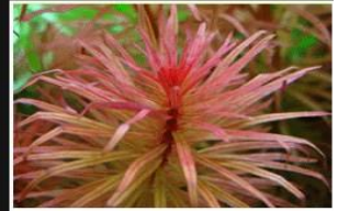
Ludwigia sp. from Panatanal