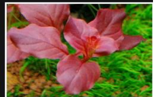
Ludwigia ovalis sp "Red"