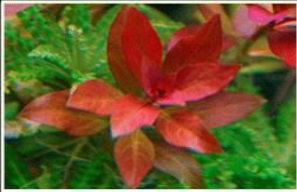
Ludwigia repens "Rubin"