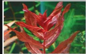
Rotala Macrandra sp. Tiger