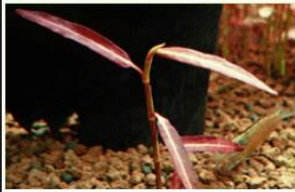
Polygonum Dichotomum Blume