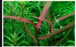
Polygonum Dichotomum sp.