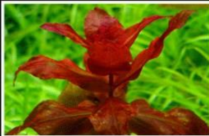
Rotala Macrandra sp.