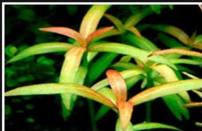
Hygrophila sp. from Pantanal