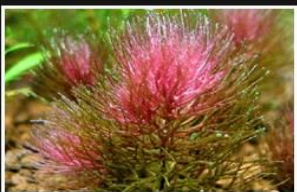
Ceratophyllum sp. from Peru