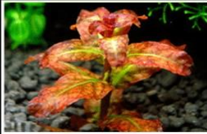
Ludwigia sp. from Guinea