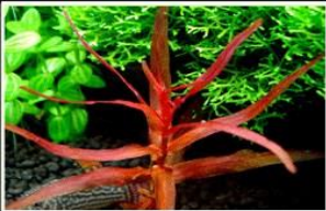
Rotala Macrandra Pointed Leaf