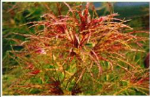
Najas sp. "Roraima"