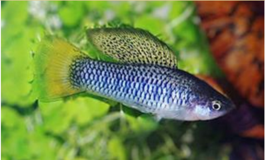
Xiphophorus birgmanni

leden uit België en Duitsland. Binnen AV Ons Genoegen zijn Gerard Jacobs en ondergetekende ook lid van Poecilia. Een aantal keer per jaar is er een bijeenkomst welke wordt gehouden bij "Twee Marken" aan het Trompplein 5 in Maarn. Afgelopen keer, 14 mei 2011, zijn Matth. en ik afgereisd naar Maarn. Het verloop van zo'n bijeenkomst is steeds volgens een vast patroon. De voorzitter opent met een welkom, waarna de diverse bestuursleden verslag doen van bijzonderheden of aandachtspunten. Hierna volgt een voorstelronde van alle aanwezige mensen, waarbij iedereen aangeeft waar hij hobbymatig zo'n beetje mee bezig is. Hieruit volgt altijd wel een onderwerp dat meer