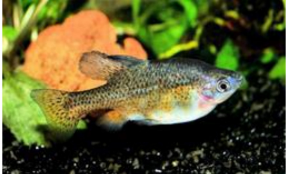
Alfaro huberi en Skiffia cf francescae

dieke blad contact opnemen met elkaar over